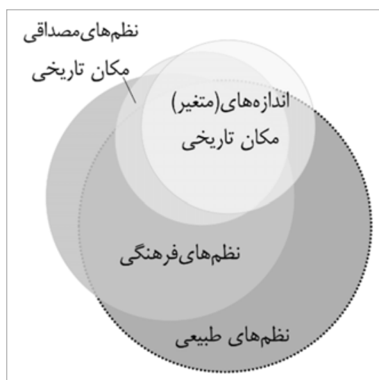
تصویر ۳. نمودار رابطه میان اندازه‌های (متغیر) مکان تاریخی با نظم‌های ناظر به آن در شکل محقق در غالب مکان‌های تاریخی (نگارندگان)

پر واضح است که هویت مکان‌های تاریخی، بدین اعتبار، از ارزش‌های کم‌وبیش برخوردار می‌شوند. از این رو، برخی از مکان‌های تاریخی، بنابر مظهریت ویژه‌ای که برای قوانین و سنت‌های حیات‌بخش طبیعی دارند، می‌تواند «هویت‌های ویژه» (مصداقی) دانسته شود. در این میان، الگوها و اندازه‌های فرهنگی نیز تا آن جا که منطبق بر قاعده‌مندی‌های طبیعی‌اند، می‌توانند موضوعیتی برای آشکارگی و بیان در هستی مکان تاریخی بیابند. در مجموع، در نسبت نظم‌های طبیعی، فرهنگی و مصداقی نیز اصالت با نظم‌های طبیعی خواهد بود. چنانچه نظم‌های فرهنگی و مصداقی اعتبار خود را از انطباق بر نظم‌های طبیعی می‌یابند.